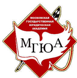
Московский государственный юридический университет им. О.Е. Кутафина